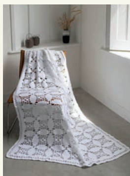
Tijdloze illusie p.110