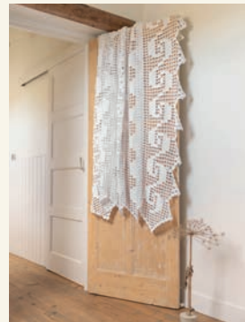
Licht en luchtig p.64