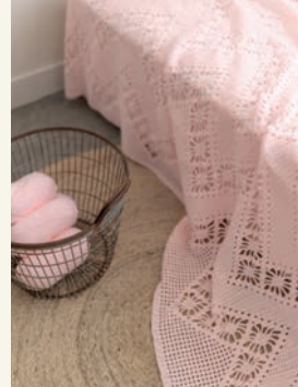
Geweven harmonie p.30