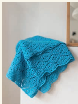
Ocean- golven p.92