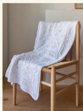
Winters wit p.118