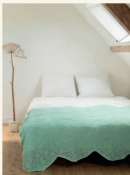
Magische momenten p.78