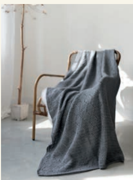
Nostalgische diamanten p.86