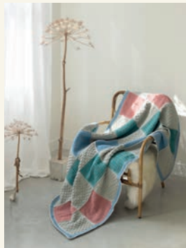
Knusse warmte p.52