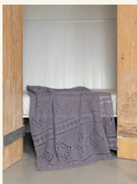
Serene serenade p.100