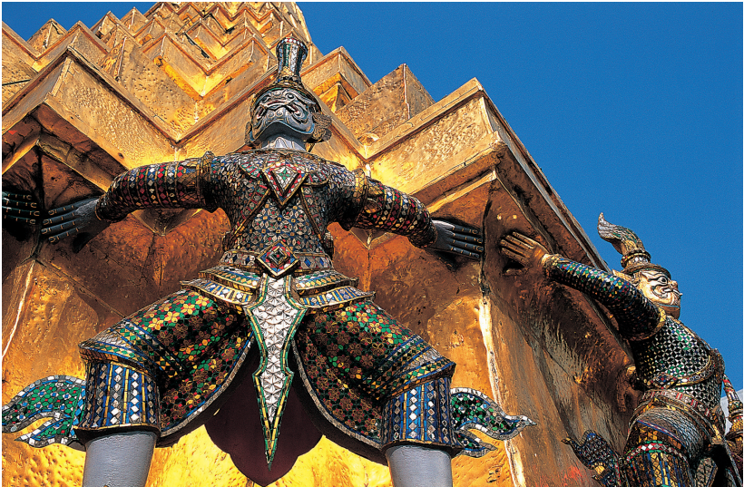
Khon-figures bewaken een stoepa in het Grote Paleis te Rattanakosin, het oude hart van Bangkok.

Het historische en culturele hart van Bangkok is Rattanakosin, de oude koninklijke stad die gelegen is in een bocht in de Chao Phraya en wordt doorsneden door vele kanalen ( khlongs ). Hier vindt u tal van architectonische en religieuze juweeltjes: het magnifieke Grote Paleis, de befaamde tempelcomplexen Wat Mahathat, Wat Suthat en Wat Phra Kaew, de beste universiteiten van de stad, het Nationaal Museum en de Nationale Galerie.