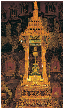
De Smaragdgroene Boeddha staat voor macht en verlichting.