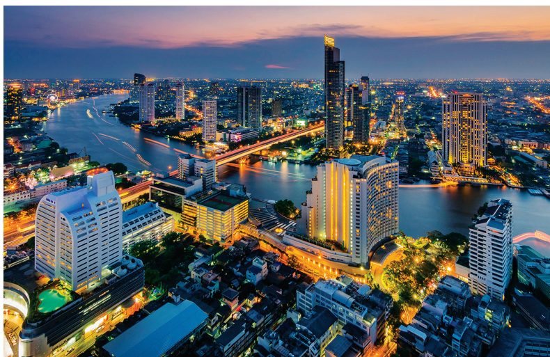
Bangkok strekt zich uit aan weerszijden van de rivier Chao Phraya.

Vanuit Rattanakosin breidde de stad zich verder uit. Chinese kooplieden weken op koninklijk bevel uit naar het oosten en vestigden een nieuwe nederzetting: het huidige levendige Chinatown. Koning Chulalongkorn (Rama V) raakte geïnspireerd door zijn Europese reizen en bouwde brede, met bomen