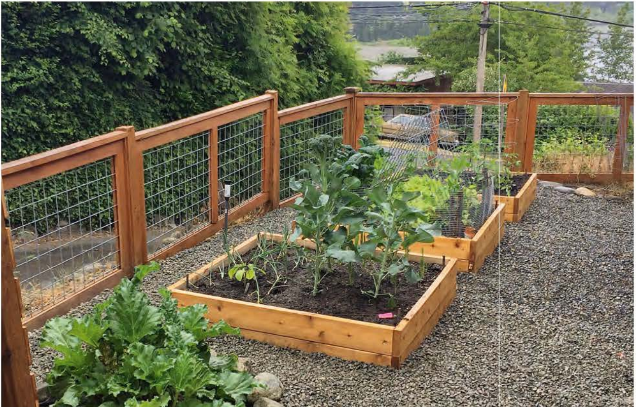
Epic Gardening-lezer Betsy Kurcinka plaatste eenvoudige verhoogde tuinbedden langs de rand van haar achtertuin.