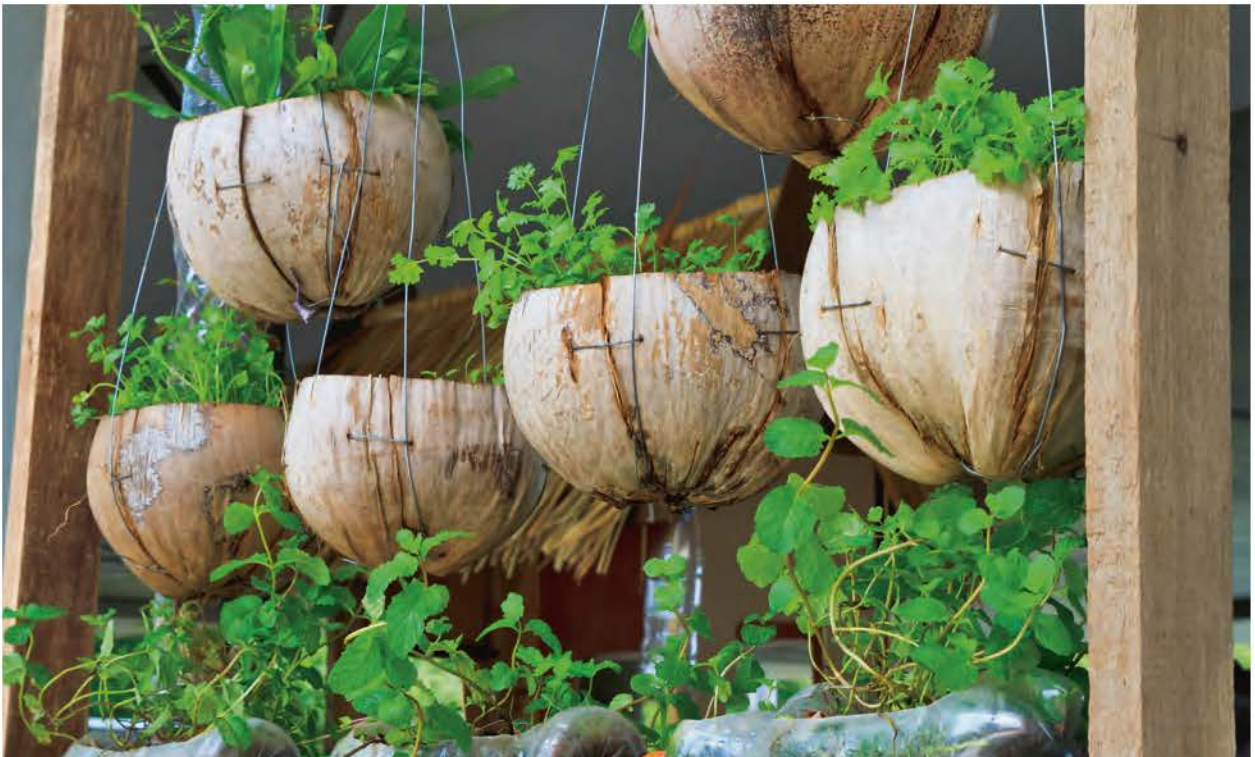
Sommige voedselresten kun je niet alleen gebruiken voor compost, maar ook als plantenbak.