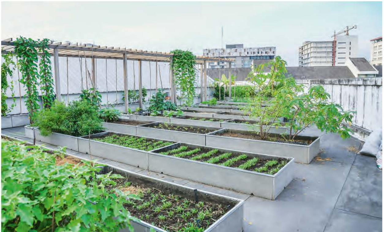
Grotere daken in de stad kun je omvormen tot groentetuinen met verhoogde tuinbedden.