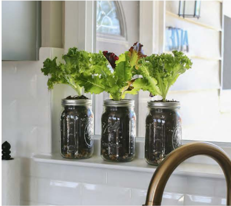
Stadstuinieren hoeft niet moeilijk te zijn; in hergebruikte weckpotten kun je in de keuken uitstekend bladgroenten kweken.