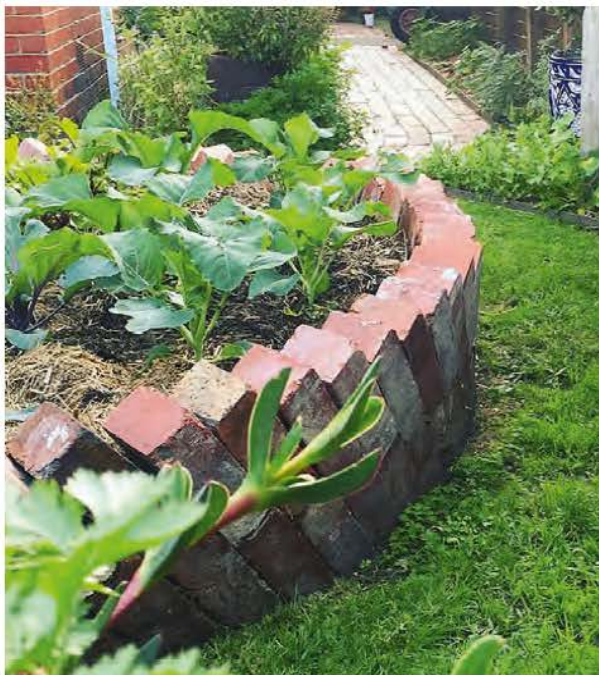
De prachtige groentetuin van lezer Suburban Existence bestaat uit tuinbedden die gemaakt zijn van diagonaal gelegde bakstenen.

Van ingewikkelde met bakstenen verhoogde tuinbedden tot prachtige balkons en eenvoudige plantenbakken met kruiden; tuinieren op een klein oppervlak kan op allerlei manieren. Ik wil je laten zien welke kweekopties bij je passen en je daarna aan de slag laten gaan – ongeacht hoe klein je leefruimte is.