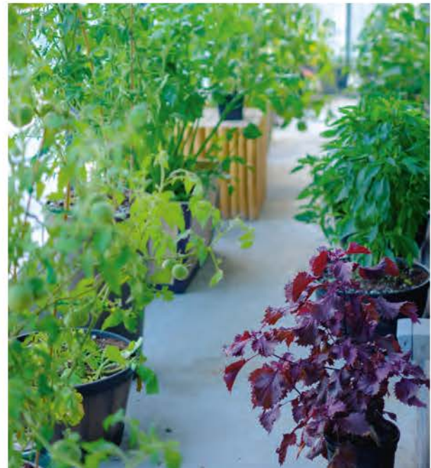
Het balkon van Ariel van Zesty and Spicy is veranderd in een productieve 'machine' van zeldzame kruiden en groenten, waaronder paarse shiso en heirloom-tomaten.