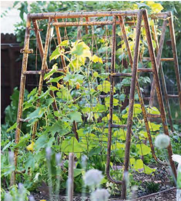
Tegen het stevige klimrek dat Katrina Kennedy maakte van oude speeltoestellen kunnen veel kalebassen groeien.