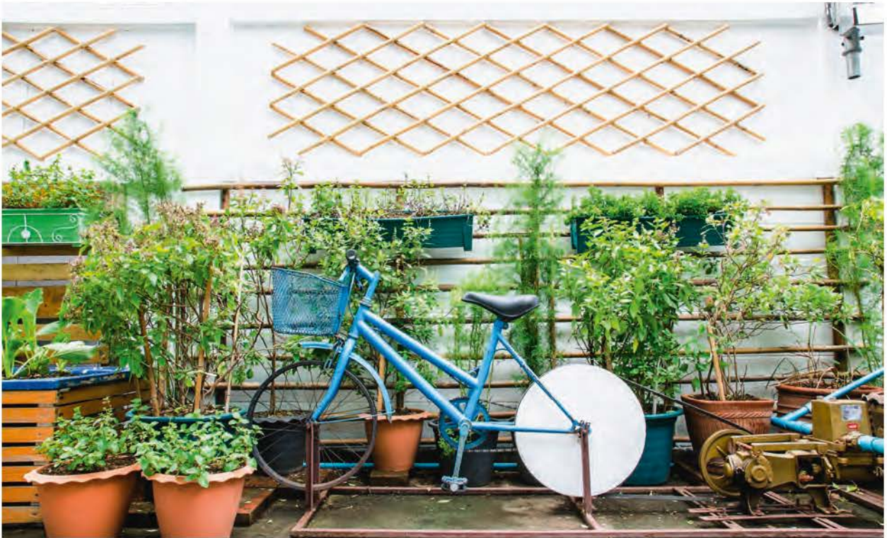
In deze stadstuin geef je al fietsend alle potten water.