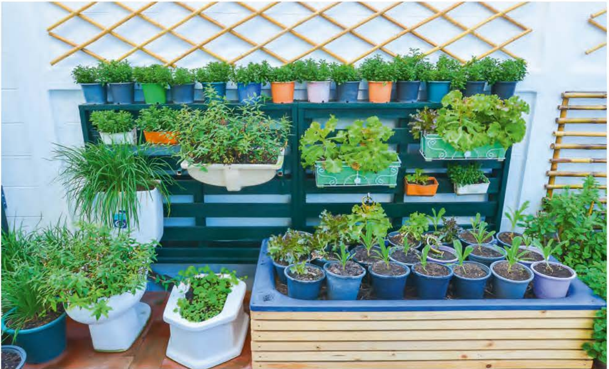
Je kunt van alles een plantenbak voor groenten maken – zelfs van een oud toilet.