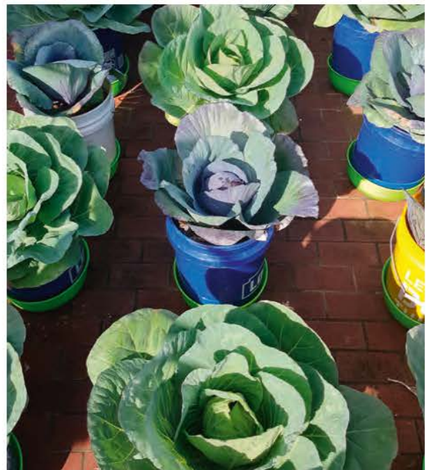
Schitterende kolen in een 20-literemmer op een patio in de achtertuin van Cuban Gardener.