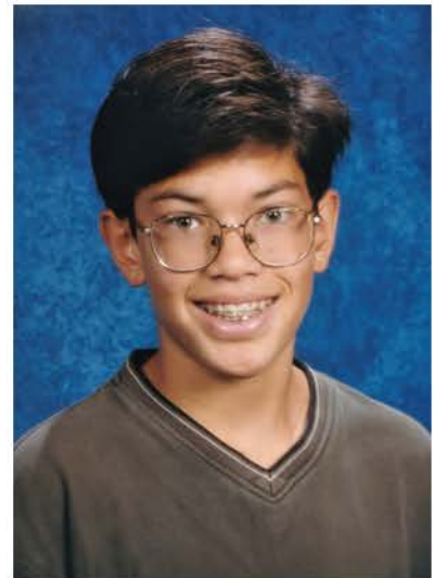
Een echte supernerd .

Dat brengt ons bij vandaag. Handboek urban gardening is het resultaat van mijn experimenten met het verbouwen van voedsel op kleine plekken. In de loop der jaren heb ik allerlei soorten planten gekweekt op balkons en dakterrassen en in kleine appartementen, gemeenschappelijke tuinen, achtertuinen, voortuinen en zelfs kasten. Ik heb zelfs geëxperimenteerd met meer methodes en plantsoorten dan ik me kan herinneren en die waren allemaal even fantastisch.