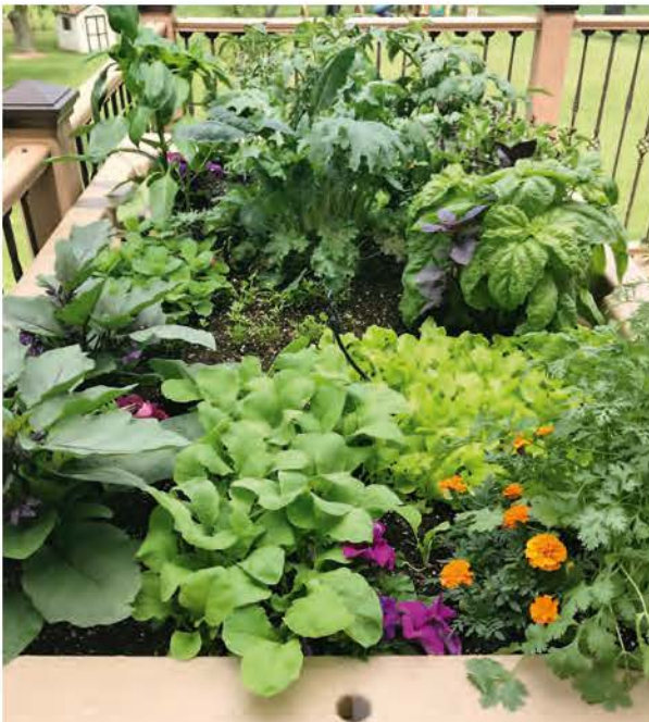
De vrijstaande patio van Kathy van Eco Garden Systems staat vol kruiden en groenten.