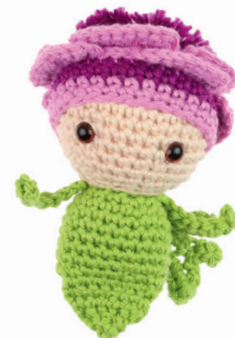
ANEMOON ANOUK 56