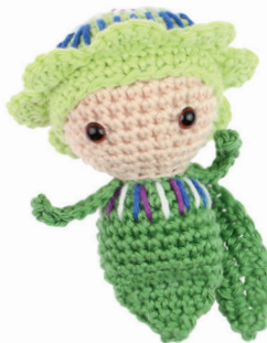
PASSIEBLOEM PUK 52