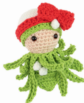
MARETAK MACI 74