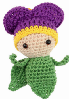
VIOLTJE VERA 42