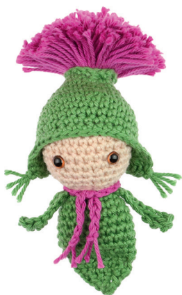
DISTEL DIRK 34