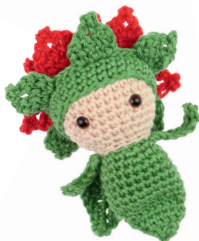
POINSETTIA PETER 68