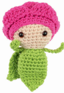
PIOENROOS PATTY 26