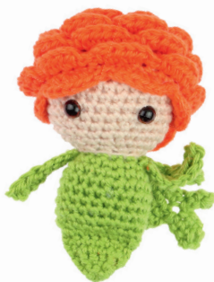
RANONKEL RON 38