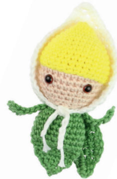
CALLA LELIE CARO 30