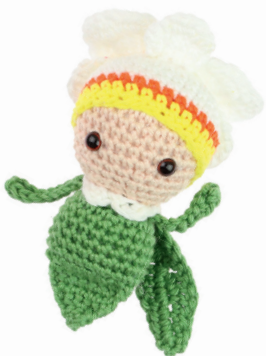
ORCHIDEE LOLA 62