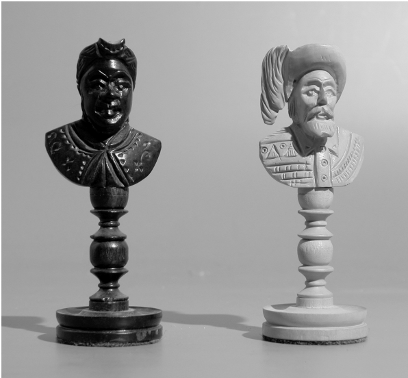
Lodewijk XIII is in dit schaakspel afgebeeld als koning. Gefabriceerd door de Italiaanse firma NIGRI in 1960. Materiaal: gemalen marmer.

Zoals ook in de algemene geschiedenis van het schaakspel valt te lezen, werd de roep om een standaard schaakspel almaar luider naarmate er meer nationale en internationale toernooien werden gehouden. Het was gewoon geen doen als iedereen zijn eigen spel meenam en ieder stuk er net weer anders uitzag. Vanaf 1850 kregen we ons huidige Staunton-schaakspel, een artistieke mix van gratie en abstractie. Het hoogste stuk, de koning, met die kroon op zijn hoofd, is een waardig kleinood.