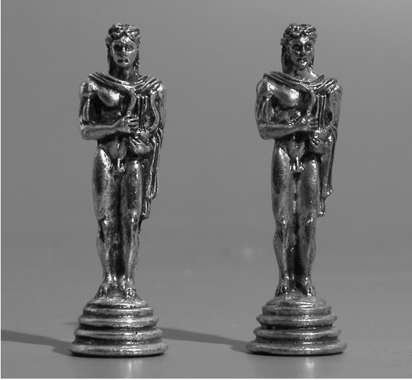
Schaakspel in Griekenland gemaakt van metaal, ca. 1960. Het verbeeldt mythologische figuren.