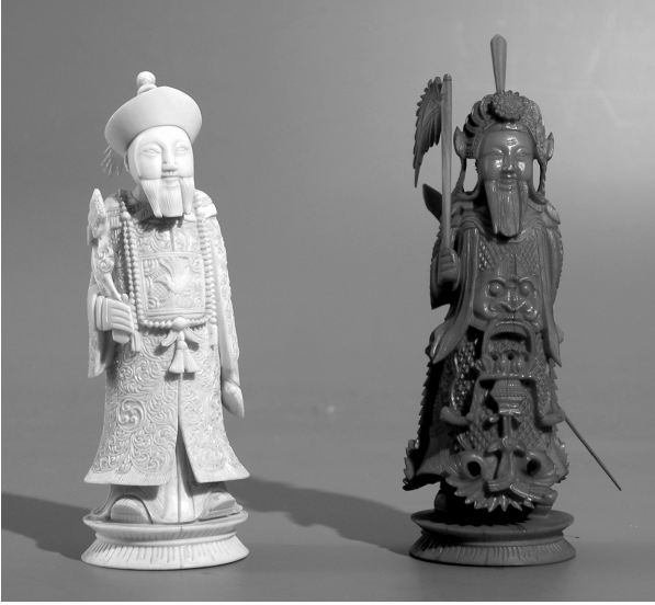
De koning van een spel uit Kanton, China, ca. 1880. Het is gemaakt van ivoor en naturel of rood gekleurd.